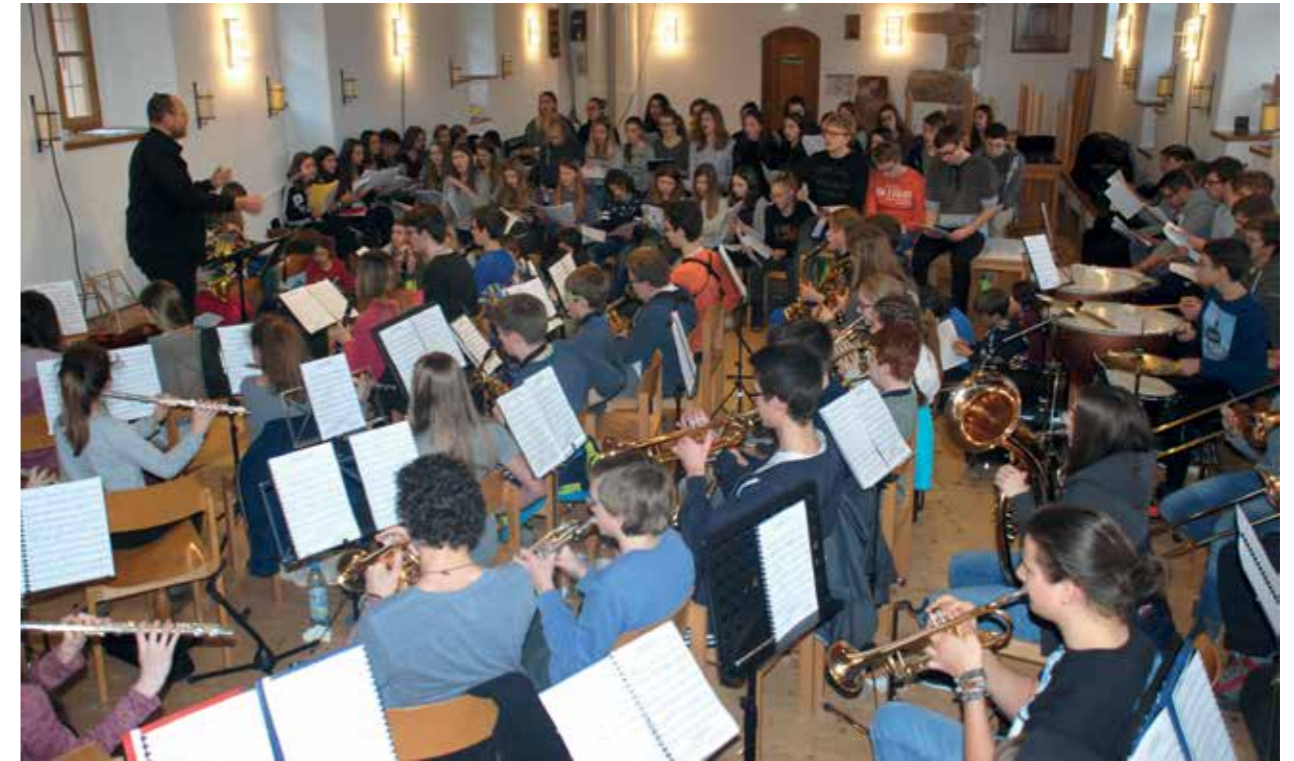
Bigband, Chöre und Streicher probten im Rittersaal

In beiden Bildungsprogrammen geht es um die Befreiung des Menschen mit den Mitteln der Bildung.