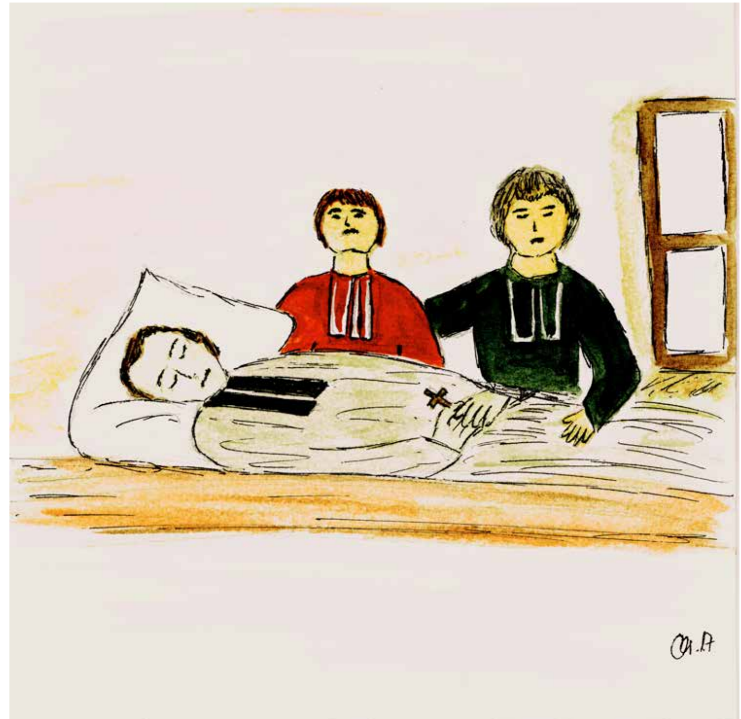
Christiane Scheubeck: Marcellins Tod

Oh here we are and here we are and here we go all aboard and we're hittin' the road here we go Teachin' all over the world Well giddy up giddy up and get away we're goin' crazy and we're goin' today here we go Teachin' all over the world And we like it, we like it, we like it, we like it here we go Teachin' all over the world And we like it, we like it, we like it, we like it we li-li-li-like it, li-li-like here we go Teachin' all over the world Status quo, Text adaptiert von Matthias Schäffer