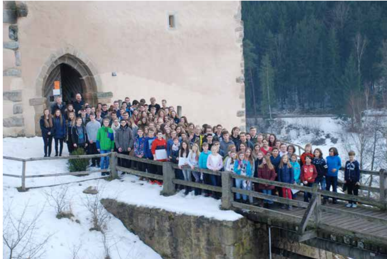
Die Mitwirkenden während der Probenwoche vor der mittelalterlichen Burg Trausnitz